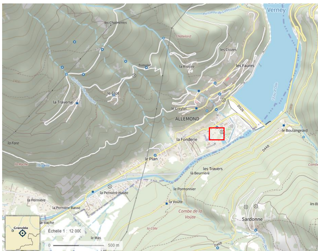
Localisation de la zone Ubc concernée par la modification simplifiée n°1 du PLU